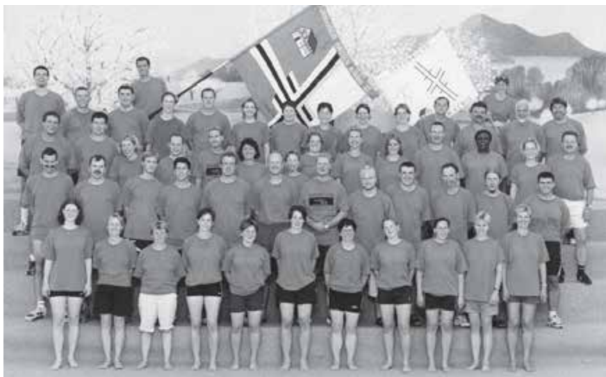
2002 Eidg. Turnfest in Basel

An den Schweizermeisterschaften verpasst Reto Götschi seinen zehnten Sieg in Serie. Ebenso verpasst er die Qualifikation für die Olympischen Spiele in Salt Lake City knapp und wird nur als Ersatzpilot aufgeboten. Die Gründe sind vielseitig. Am Ende der Saison gibt Götschi seinen Rücktritt vom aktiven Bobsport bekannt. Fredi Steinmann kommt wiederum die ganze Saison im Europacup zum Einsatz und kämpft, wie zurzeit alle Bob Teams, mit Bremserproblemen. Auch er verabschiedet sich vorläufig vom aktiven Bobsport.