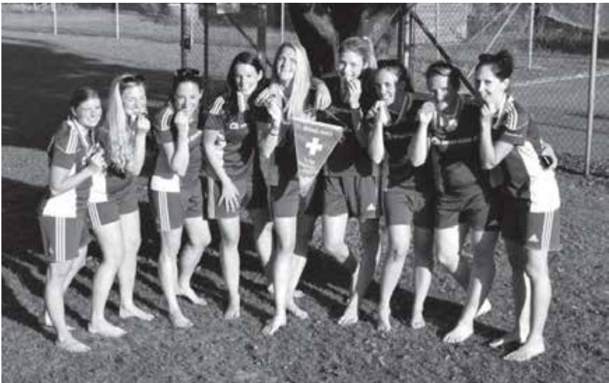
Korball Damen Aufstieg Nationalliga B