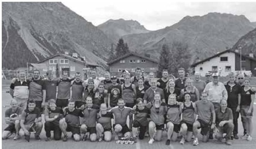
Vier Teams an der Sportstafette Arosa 2018