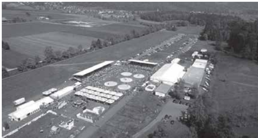
Das Schwingfestgelände auf dem Flugplatz