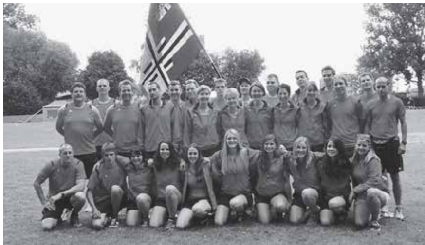
2013 Eidg. Turnfest in Biel