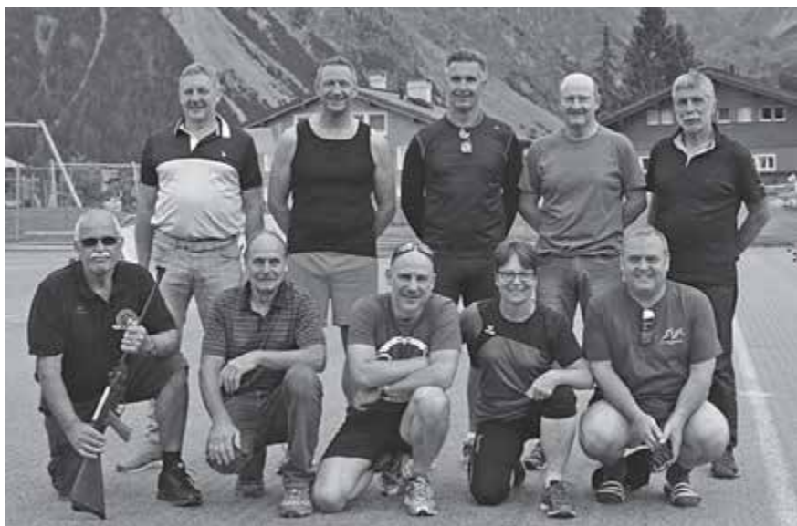
Team TV Hausen Legenden: