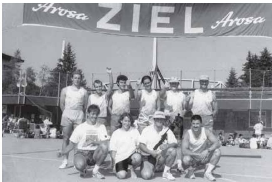
Sportsstafette, Arosa 1992

Organigramm und die entsprechenden Pflichtenhefte unterstützen die einzelnen Verantwortlichen bei der Arbeit. Ein Neuanfang einer Organisation, die vielleicht bei anderen Vereinen auch Schule machen wird.