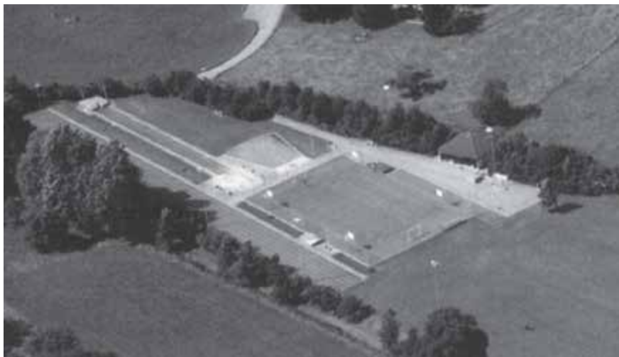
Sportplatz Jonentäli, 1985

Sportplatz Jonentäli ein. Nach siebenjährigem Unterbruch führten wir wieder ein gemeinsames Rangturnen durch. Bei den Turnfesten in Gümligen und Männedorf traten wir in der 2. Stärkeklasse an. Das Ziel unseres Oberturners, bald wieder in der ersten Stärkeklasse mitzumachen, rückte näher.