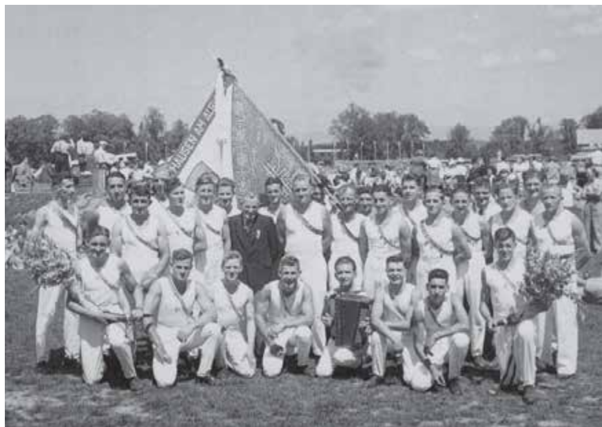
Eidgenössisches Turnfest, Bern 1947

werden. Zugleich wurde beschlossen, anlässlich der Fahnenweihe die Verbandsinspektion zu übernehmen. Am 21. Juni 1947 wurde in einem frohen Dorffest die Weihe des neuen Banners vorgenommen, die Verbandsinspektion vom 22. musste bei schlechtem Wetter durchgeführt werden und fiel buchstäblich ins Wasser.