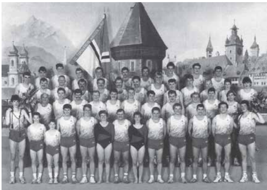
Eidgenössisches Turnfest, Luzern 1991

Dass der Aufstieg der Korbballer in die Nat. B wirklich nur noch an einem kleinen Faden hängt, bewiesen sie bei den diesjährigen Aufstiegsspielen. Ein Gegentreffer in den letzten fünf Sekunden machte alle Träume zu Nichte.