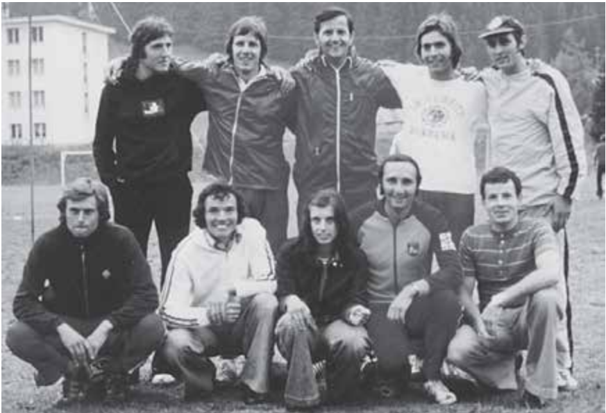
Sportstafette, Arosa 1975