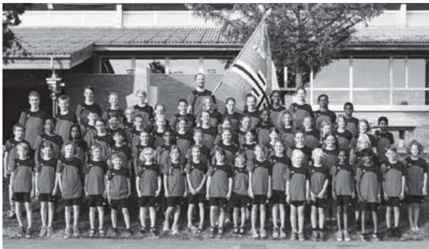
Haben sichtlich Freude am neuen Outfit – die Kinder der Jugendriege