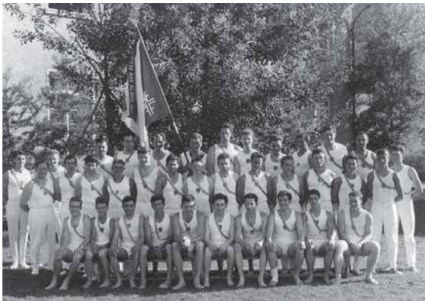
Eidgenössisches Turnfest, Luzern 1963

brachte der erfreuliche Verlauf dieses Dorffestes seine Genugtuung. Nach einer kleinen Verschnaufpause zog der TV Hausen frischgestärkt nach Arosa zur Sportstafette, wo einmal mehr der Sieg winkte. An einer ausserordentlichen GV wurde dem Kauf einer Alphütte, genannt Chalthüttli, im Skigebiet ob Filzbach zugestimmt. Wiederum war es Jules Gaisser, der die Gesamtkoordination zum Ausbau dieses zukünftigen Skihauses übernahm.