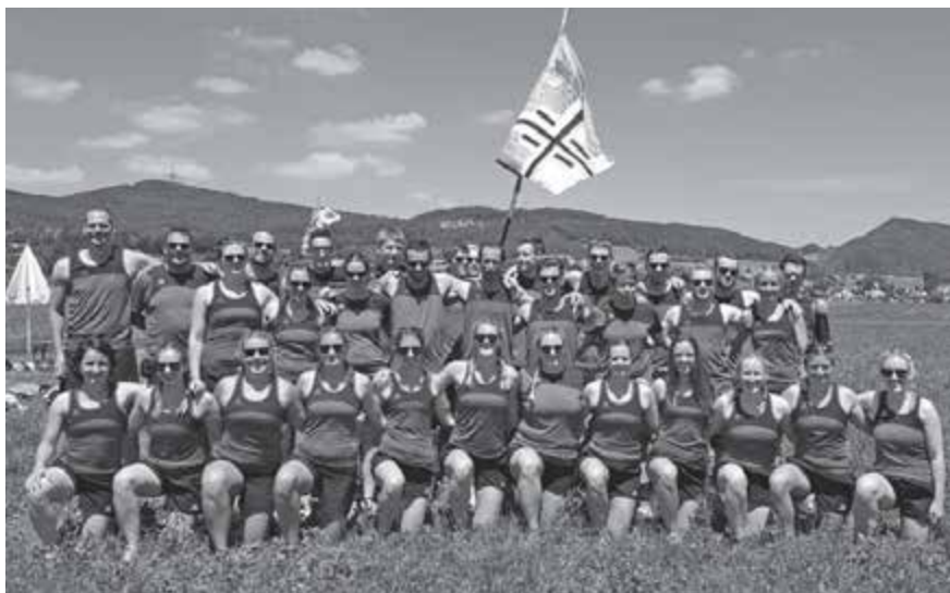
Solothurner Kantonallturnfest 2018

Die sechzigste Teilnahme an der Sportstafette Arosa war ein weiterer Höhepunkt in diesem Jahr. Gleich vier Mannschaften bekamen in Arosa aufgrund unseres Jubiläums Startrecht. Zum ersten Mal war eine reine Damenmannschaft am Start. Dann ein Team «Old Stars» die einen Altersdurchschnitt von vierzig Jahren aufwiesen und sensationell den vierten Rang erreichten. Ein Team «Legenden», mit einem Altersdurchschnitt von knapp sechzig Jahren, kam leider nicht über den letzten Rang hinaus. Das Fanionteam verpasste den Sieg nur knapp und belegte den hervorragenden zweiten Rang.