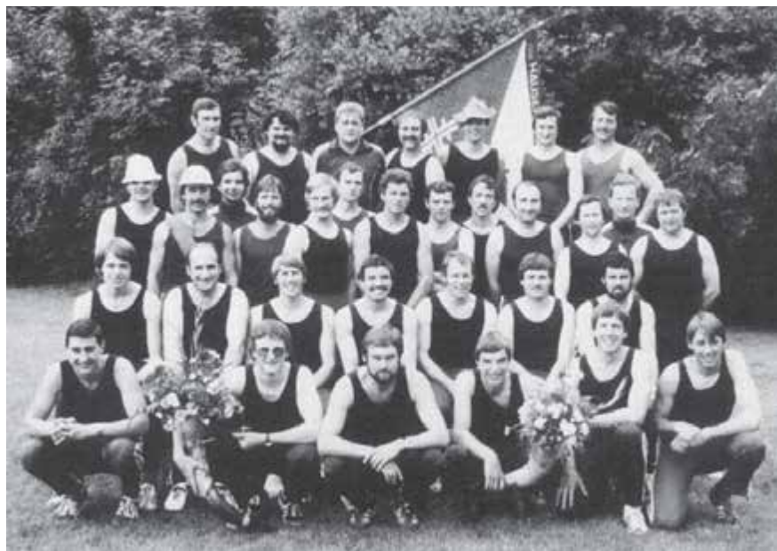
Eidgenössisches Turnfest, Genf 1978