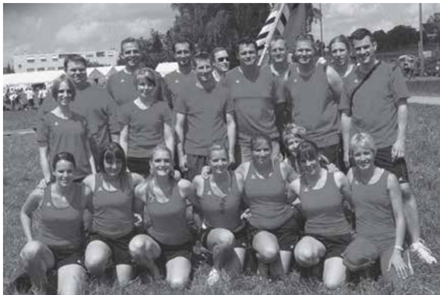
2011 Zürcher Kantonal-Turnfest in Wädenswil

Das Damenkorbballteam gewinnt das Korbballturnier und wird somit Turnfestsieger. Erstmals werden auch Jugendwettkämpfe an einem Turnfest angeboten. 27 Kinder der Jugi Hausen absolvieren einen dreiteiligen Vereinswettkampf. In der 2. Stärkeklasse ergab dies mit einer Note von 24.71 den 4. Rang.