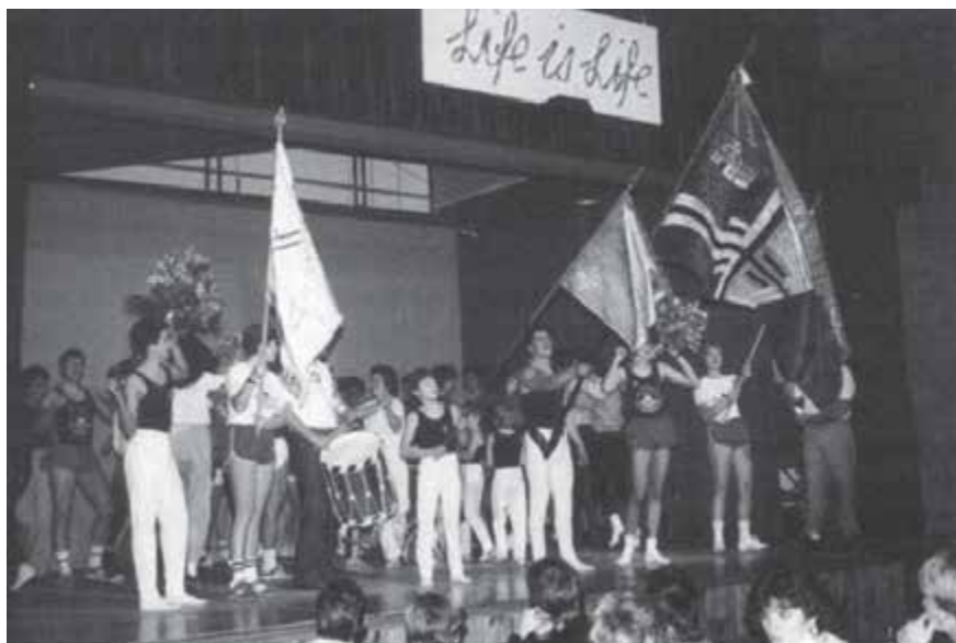
Chränzli 1986, Motto «Life is Life»

Wie in den vorhergegangenen Jahren nahmen wir wieder an zwei Turnfesten teil. Mit einer steten Leistungssteigerung durfte auch dieses Jahr wieder gerechnet