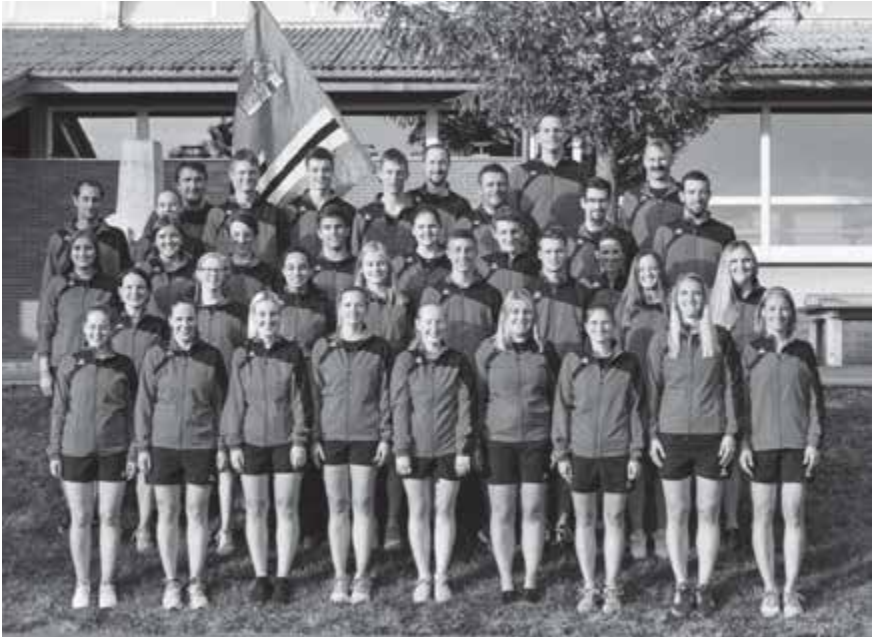
Der TV Hausen am Albis im Jubiläumsjahr