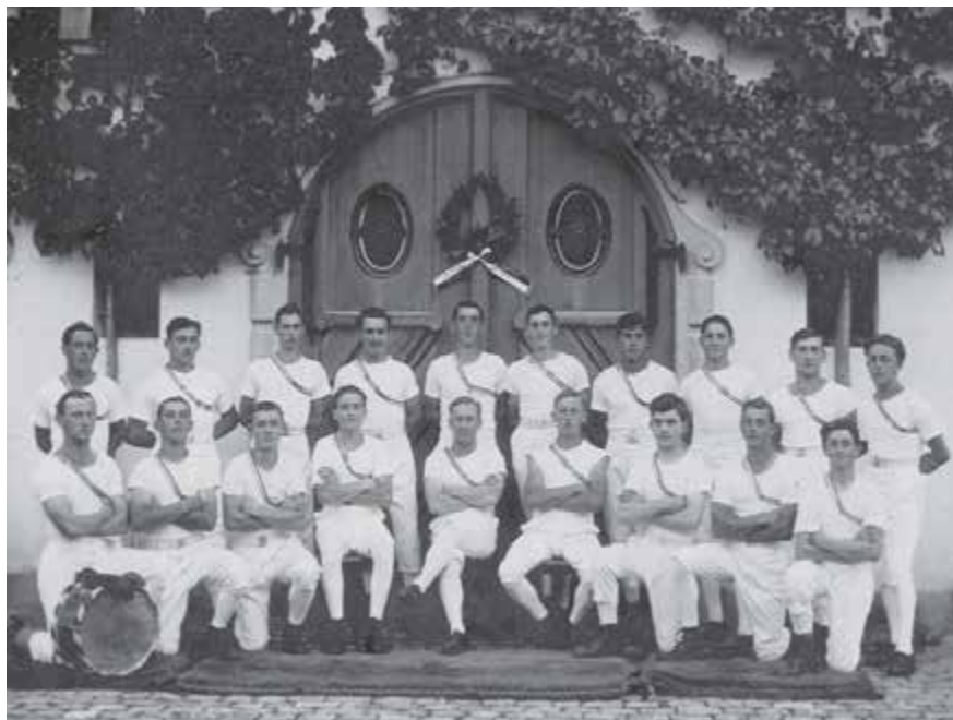
Eidgenössisches Turnfest, Genf 1925

Albis Turnverbandes in Birmensdorf besucht. 1921 kehrte der Verein mit einem Eichenkranz vom gleichen Anlass aus Leimbach ins heimatliche Dorf zurück. Leider aber konnte die Bevölkerung den grossen Wert des Turnens noch nicht erkennen, und die damaligen Turner mussten sich Vorwürfe gefallen lassen, die jeder Grundlage entbehrten. So ist es nicht verwunderlich, dass die leitenden Männer den Mut verloren. Mitgliederschwund und einige Wechsel in den wichtigen Chargen führten zu einer Krise, die im Herbst 1924 ihren Höhepunkt erreichte.