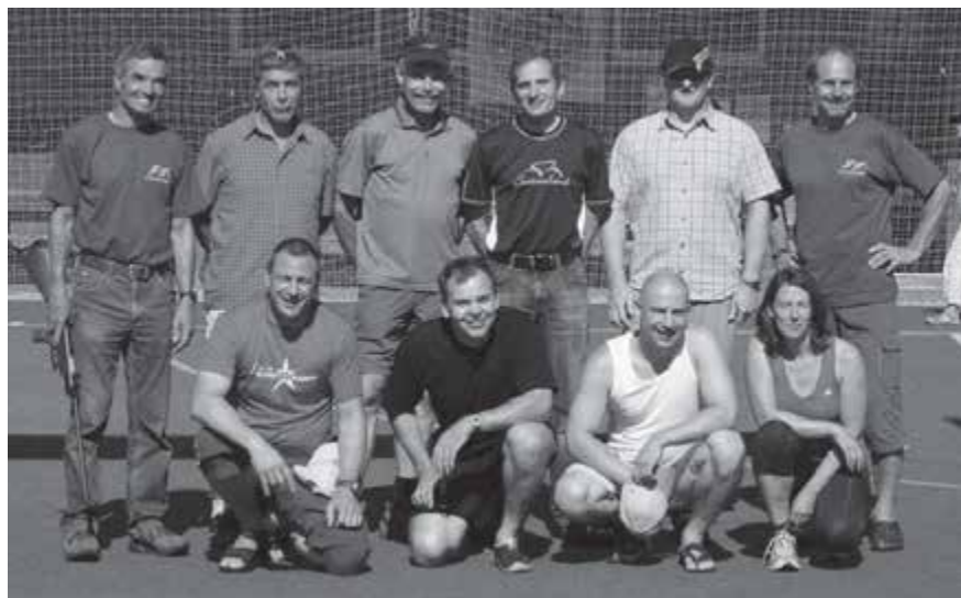
2008 Jubiläumsmannschaft Arosa

Die Chilbi im Dorf wird seit einigen Jahren durch die Vereine, mit einem von der Gemeinde bestimmten OK, bestehend aus Vertreterinnen und Vertreter aus diversen Vereinen, als Dorffest organisiert. Immer wieder werden neue Ideen gesucht, um den Anlass attraktiver zu gestalten. Klassenzusammenkünfte, Grümpelturnier, Laufwettbewerbe oder wie dieses Jahr ein Spielwettkampf «Hausen ohne Grenzen», sollen dafür sorgen, dass mehr Leute angezogen werden. Seit einigen Jahren wird auch die schon traditionelle «Sonderbar» an der Chilbi vom Turnverein im «Schöpfli» geführt.