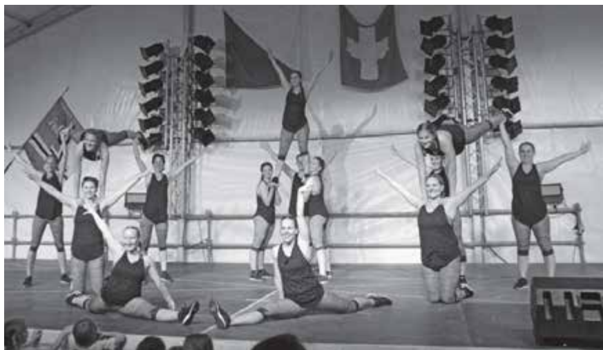
Vorfürbrungen am Unterhaltungsabend, Team-Aerobic der Damenriege und Kunstturner Nationalmannschaft