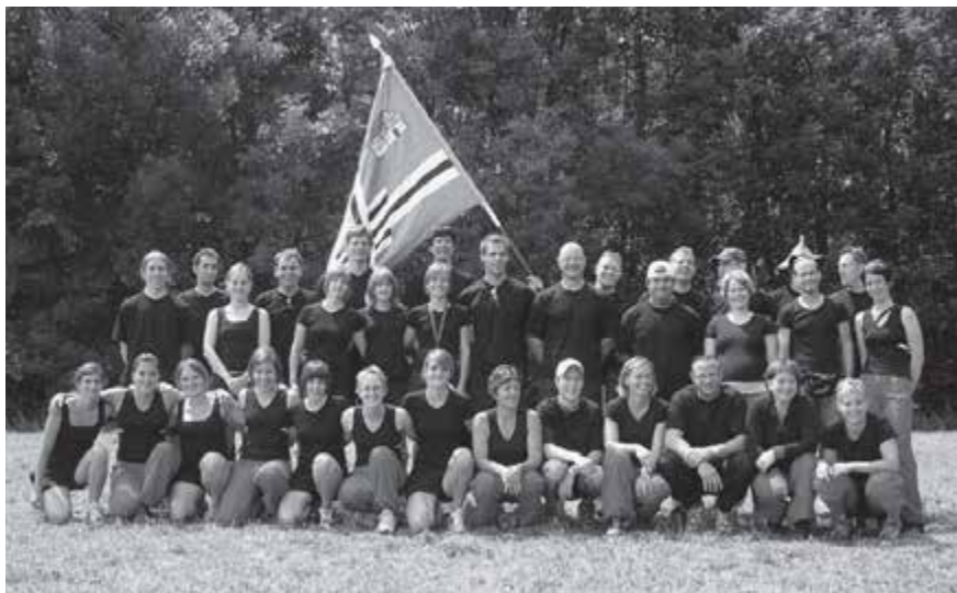
2007 Eidg. Turnfest in Frauenfeld

Am Eidgenössischen Turnfest in Frauenfeld standen über 30 Turnerinnen und Turner im Einsatz. Gemäss neuem Wettkampfglement gibt es nur noch gemischte Sektionswettkämpfe. In der 3. Stärkeklasse konnte der 48 Rang mit der sehr guten Note von 26.03 erreicht werden. Einmärsche im Dorf gibt es keine mehr. Im Lindenhof wurde am Sonntagabend ein Ausklang organisiert, an dem die Gemeinde ein Imbiss spendiert.