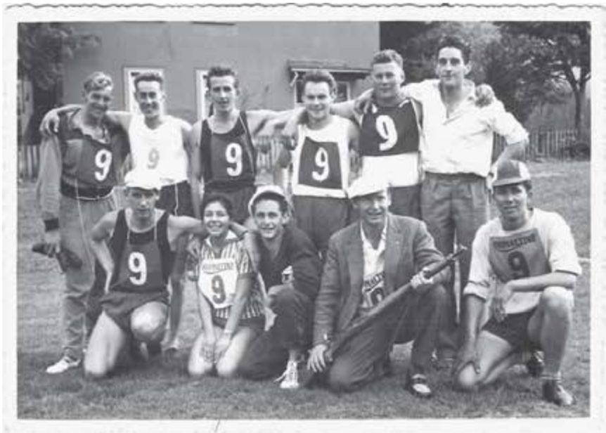
Sportsstaffette, Arosa 1958

Eine interne Jubiläumsfeier im September, mit vielen Darbietungen, Reden und Verdankungen und einem Galadiner sowie dann im Dezember noch ein gemeinsamer Chlaushock mit allen Riegen schloss unser Jubiläumsjahr ab. Dabei wurde vor allem